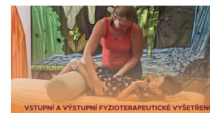
VSTUPNÍ A VÝSTUPNÍ FYZIOTERAPEUTICKÉ VYŠETŘENÍ

V roce 2020 jsme museli pobyty oproti předchozím letům hodně upravit. Po zrušených jarních pobytech, které jsme se snažili alespoň částečně kompenzovat skype konzultacemi, jsme během léta mohli pobyty realizovat ještě relativně ve stejném duchu. Na podzim a v zimě jsme ale z důvodu protiepidemických opatření mohli provozovat jen ambulantní formu léčby. Jako nestátní zdravotní zařízení jsme sice mohli hipoterapii provozovat, ale ubytování nikoliv. Museli jsme tedy některé z výše uvedených skupinových aktivit, jako například muzikoterapii a arteterapii, omezit a rodiče za námi své děti každý den vozili. Efekt takových pobytů samozřejmě není stejný, ale jsme velmi rádi, že aspoň nějaká možnost byla a také, že jsme rok 2020 nakonec všichni finančně i zdravotně ustáli.